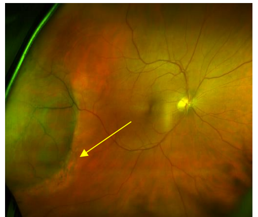
La Retina con enfermedades

Yo no doy autorisacion para el examen adicional